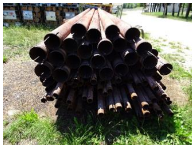
die alten Rohre