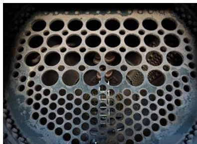
Rohrrechen im Kessel

Um die Lok wieder auf Fahrt zu bringen, sind im Kessel neue Siede – und Rauchrohren zu installieren.