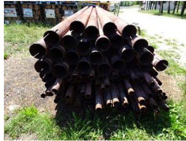
die alten Rohre