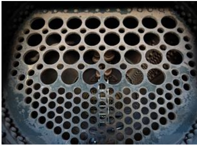
Rohrrechen im Kessel

Um die Lok wieder auf Fahrt zu bringen, sind im Kessel neue Siede – und Rauchrohren zu installieren.